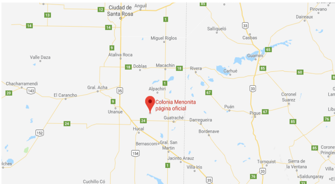
Mapa de ubicación de La Nueva Esperanza

La estancia donde los menonitas se instalaron se encuentra a 40 km de la pequeña localidad de Guatraché. Dicha estancia se encuentra cercada por caminos de tierra, entre los cuales se destacan las rutas provinciales N° 3 y 24 y pavimentados como la ruta Provincial N° 1. La ruta provincial N°24 comunica con la ruta Nacional N° 35 que la conecta con las dos ciudades más importantes de la región: Santa Rosa, capital provincial a 181 km. y Bahía Blanca, en la provincia de Buenos Aires, a 200 km. aproximadamente.